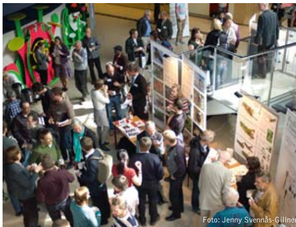
Under konferensens pauser minglades det intensivt.

Den senare delen av konferensen handlade till stor del om varför mångfaldsmålen inte nåtts, och vad som kan göras annorlunda. Man efterlyste nya grepp med stor effekt. Exempelvis föreslog Naturskyddsföreningen via Svante Axelsson att subventioner som forcerar utfiskning måste försvinna. Deltagarna gavs möjlighet att komma med egna förslag på åtgärder för att hejda förlusterna av biologisk mångfald i Sverige. Dessa sammanfattades i en lista som kommer att sändas till samtliga riksdagspartier.