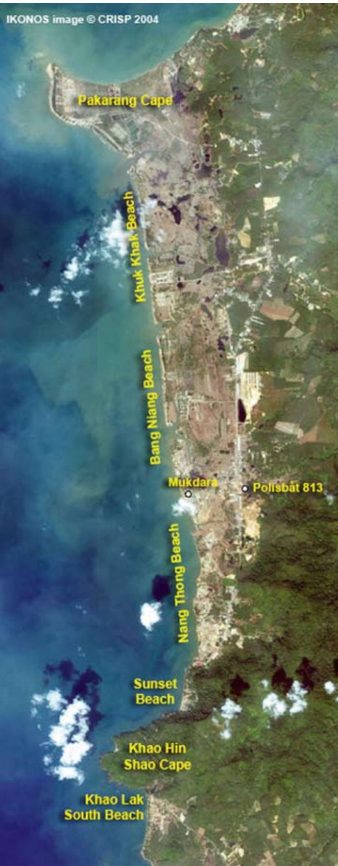
Satellitbild över norra Khao Lak efter tsunamin. Man ser den cirka två kilometer långa remsan där skadan var som störst. I Nang Thong Beach uppmättes den högsta vattennivån.